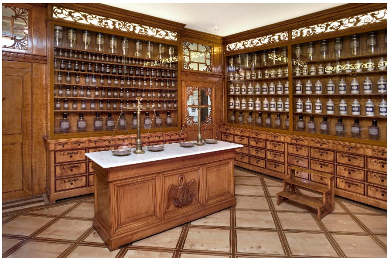
La pharmacie de l'Hôtel-Dieu, photographie de Jacques Bélat.