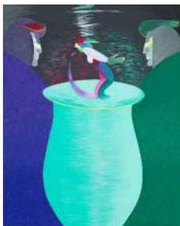
Vase orné de rêves I , 2006 acrylique sur toile, 100 x 80 cm

17h : Finissage de l'exposition René Myrha – Un Temps chasse l'autre